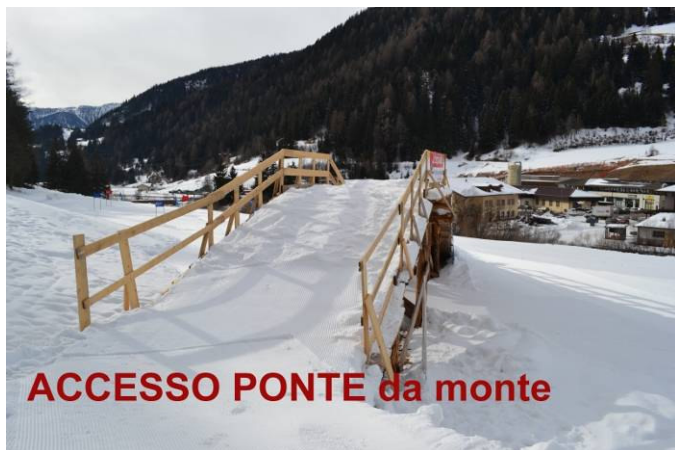
ACCESSO PONTE da monte

Tel. e Fax 0462/574101 www.usmontipallidi.it